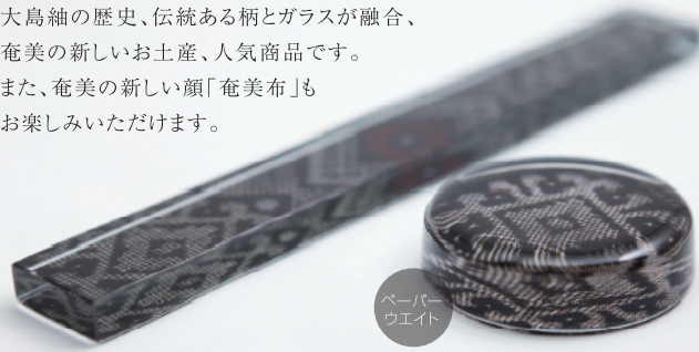
ペーパー ウェイト

大島紬の歴史、伝統ある柄とガラスが融合、 奄美の新しいお土産、人気商品です。 また、奄美の新しい顔「奄美布」も お楽しみいただけます。